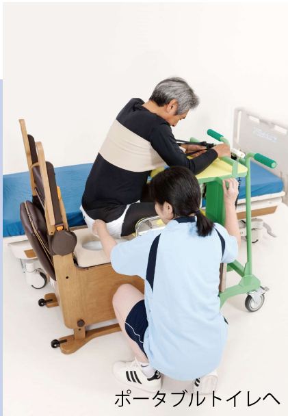
ポータブルトイレへ