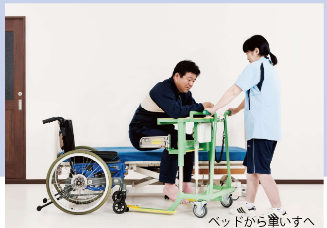
ベッドから単いすへ